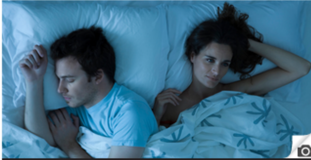
Pareja con problemas. | Otras

ESTRELLA DIGITAL 27/09/2014 | 11:47 H. RELACIÓN PAREJA PROBLEMAS SOLUCIONES ESPECULACIONES